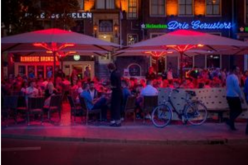
Mensen die roken

Vandaag, donderdag 31 mei, gaf staatssecretaris van VWS, Paul Blokhuis, op NPO Radio 1 aan dat hij roken op het terras wil verbieden. Koninklijke Horeca Nederland (KHN) vindt dit betutteling ten top.