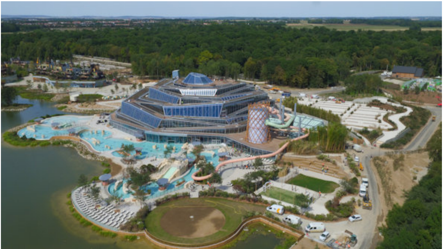
Villages Nature - een gezamenlijk project van Disneyland Paris en Center Parcs Pierre et Vacances

Twee jaar geleden werd het luxe resort Villages Nature geopend, dat door CenterParcs en Disney Resorts gezamenlijk in de markt wordt gezet. De laatste jaren zijn al diverse recreatiecollega's met mij (red. Hans van Leeuwen) al op inspiratiereis geweest naar het beste Themapark ter Wereld Puy Du Fou, met aansluitend een bezoek aan Villages Nature.