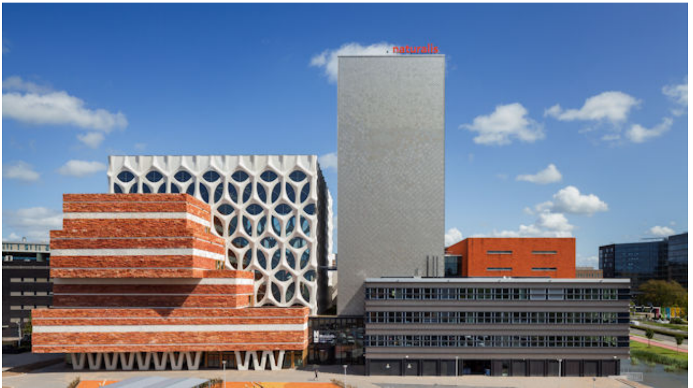
Naturalis, Leiden, Neutelings Riedijk architecten