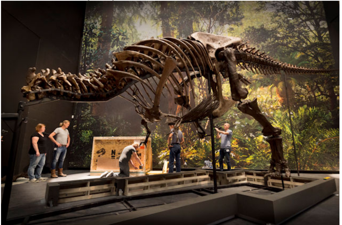
T-rex in opbouw