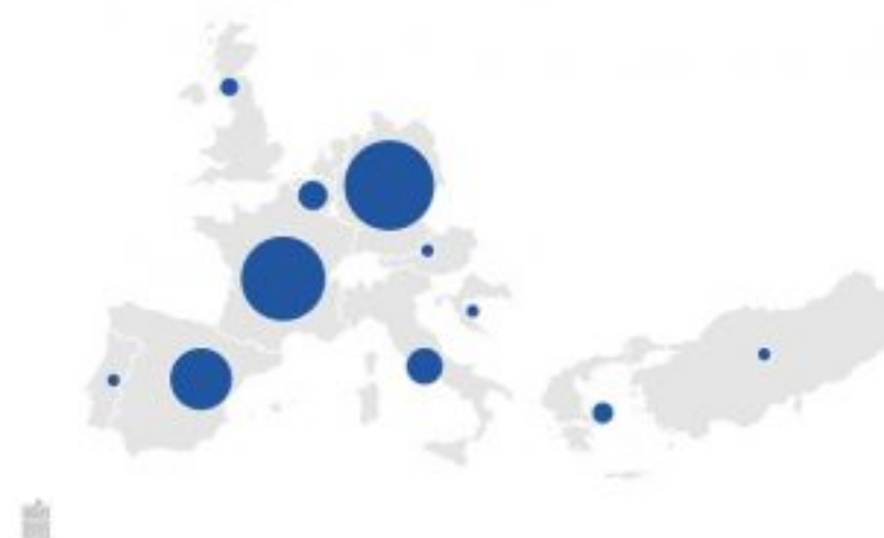
Buitenlandse zomervakantiebestemmingen van Nederlanders, 2017

Favoriete bestemmingen Bijna 90 procent van de buitenlandse zomervakanties had een Europese bestemming. West- en Zuid-Europa waren hierbij het meest in trek, met achtereenvolgens 44 en 31 procent van de vakanties. Vakanties buiten Europa gingen voor het grootste deel naar Azië en Noord-Amerika. De favoriete buitenlandse vakantiebestemming in 2017 was Duitsland, waar ruim 2,1 miljoen vakanties werden doorgebracht. Frankrijk (2 miljoen) en Spanje (1,5 miljoen) volgen als tweede en derde bestemming. Duitsland trekt vooral Nederlanders voor een korte vakantie (met maximaal drie overnachtingen), voor lange zomervakanties van vier of meer overnachtingen staat Frankrijk op de eerste plaats. Bron en meer informatie: CBS Steeds meer marketingbudget naar online campagnes Roy Platje, directeur van RED online marketing (specialist in travel en leisure), ziet dat zijn klanten een steeds groter deel van hun marketingbudget inzetten voor online campagnes. Hulp nodig bij online marketing? (b.v. campagnes op Google en Facebook), neem dan contact op met RED Online Marketing