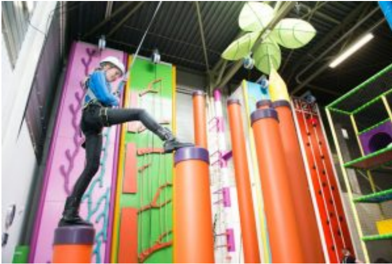
Fun Climb - Monkey Town Apeldoorn[/caption]

Klimmen zit niet meteen in de genen van de Nederlandse consument. We hebben geen bergen om te beklimmen of een brede traditie van scouting, waar klimmen tot de basisvaardigheden behoort. Toch neemt de populariteit van klimmen in Nederland toe. Klimmen in Nederland heeft zich ontwikkeld in klimhallen, waar je op een klimmuur de uitdaging aangaat. Deze activiteit werd vooral sportief beoefend. Indoor neemt het klimmen een vlucht en er worden steeds meer klimvormen aangeboden die 'het klimmen' in een meer recreatieve vorm aanbieden. Deze klimvormen zijn daarmee ook interessant geworden voor een recreatief groepsuitje. Deze klimvormen zijn dan ook geschikt als onderdeel van een Family Entertainment Centrum. Er zijn verschillende verschijningsvormen van indoor klimmen en klauteren: [caption id="attachment_55571"