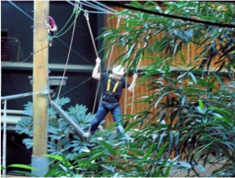
klimmen bij CenterParcs Vossemere[n]/caption]

High rope parcoursen Dit soort uitdagingen zijn ook wel bekend als rope courses. Ook hier gaan de deelnemers gezekerd het parcours op. Er is veel variatie mogelijk waarbij het parcours wordt voorzien van allerlei verschillende obstakels en uitdagingen. Bijvoorbeeld een touwbrug of balanceerelementen. Het voordeel van een rope course is dat je deze in een fysiek hoge ruimte boven andere activiteiten kunt plaatsen. Zo bespaar je op oppervlakte. We zien dit soort installaties ook al verschijnen in winkelgebieden. Active Fun Park Bij Active Fun Parken of Net Adventures (door Active Constructions) is het niet nodig om deelnemers te zekeren. De valveiligheid is hier gegarandeerd door een nettenstructuur. De Net Adventure producten hebben meerdere voordelen zoals een hoge capaciteit, lage personeelskosten en gericht op grote doelgroepen. Een active fun park bestaat uit verschillende elementen, die naar eigen inzicht aan elkaar gekoppeld kunnen worden, zoals bounce netten, tube slides, klimnetten en touwbruggen. Er wordt op dit moment ook getest met bounce elementen binnen de nettenstructuur. [gallery columns="2" link="file" size="medium" ids="55561,51857"] Caving Een nieuwe vorm van klimmen betreft het caving. Hier wordt het grotklimmen of speleologie nagebootst. Het is geen sport voor mensen die last hebben van claustrofobie. Waar bij de trampolineparken sprake is van merken en franchiseconcepten, zien we dat in de klimwereld vooralsnog niet ontstaan.