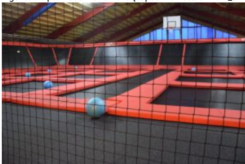
Bounz @ Hof van Saksen[/caption] Grote

komen uit de hoek van de technologie. De ValoJump maakt gebruik van augmented reality. De springer op de trampoline ziet zichzelf op een groot scherm, waar een computerspel aan de werkelijkheid wordt toegevoegd. De speler krijgt daarmee een actieve rol in het computerspel. Ook de toevoeging van een geavanceerd camerasysteem ( Sidijk Action Cam ) zien we als een nieuwe toevoeging. Via een rfid tag in een armband kan de gast worden gevolgd op zijn tocht langs diverse uitdagingen. Aan het eind van de sessie worden de foto en/of videobeelden samengevoegd. De beelden kunnen worden gebruikt als extra verdienmodel of worden ingezet als promotie-instrument. [caption id="attachment_54120" align="alignright" width="300"]