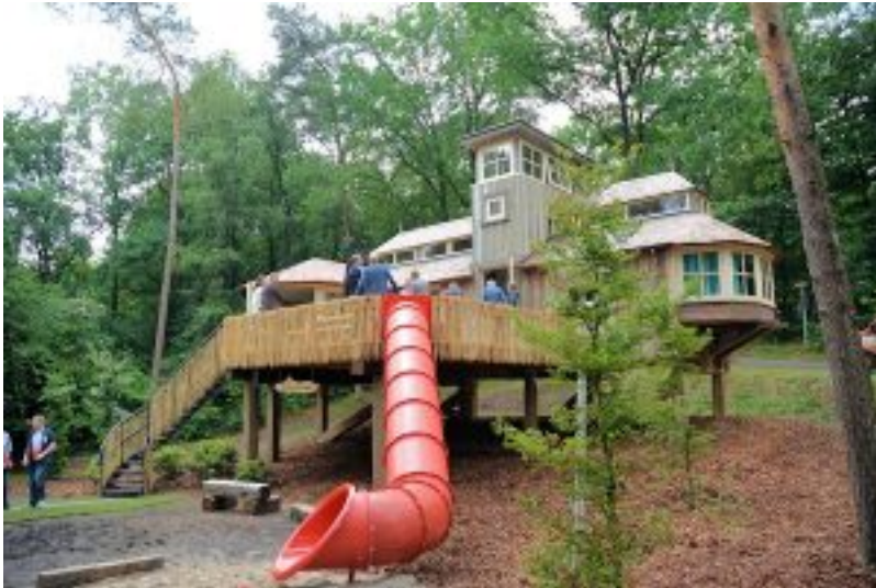
Boomhuis Landal Miggelenberg

(Veluwe)[/caption] Volgens de boekingsaantallen van HomeToGo werden de meeste Nederlandse vakantieaccommodaties geboekt op de Veluwe, in de Noordzeebadplaatsen en op de Waddeneilanden.