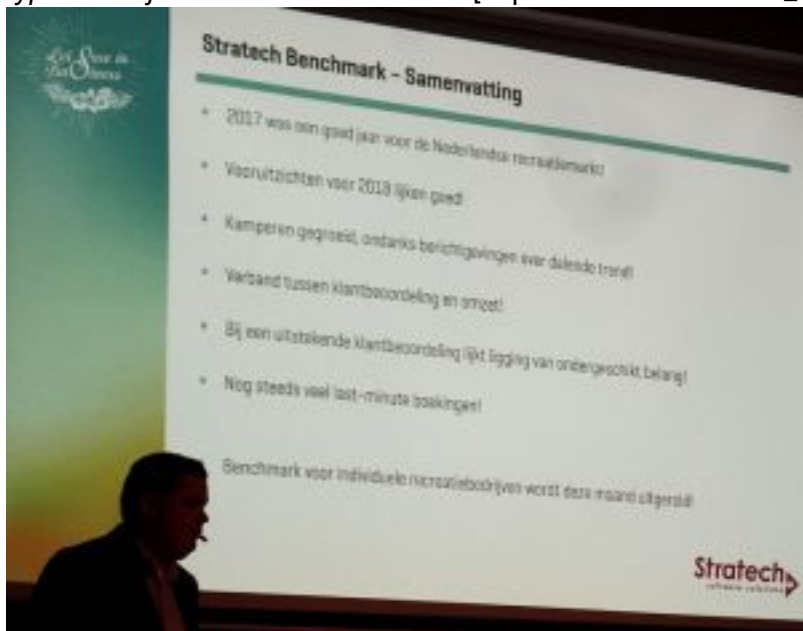
samenvatting uit de Stratech