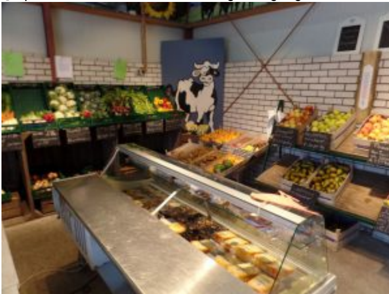
Boerderijwinkel Nieuw Slagmaat[/caption]