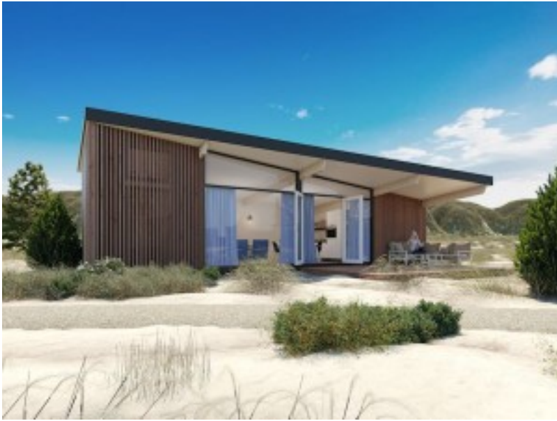
Sea Lodges Bloemendaal[/caption] Driekwart

meer boekingen voor Noord-Holland De Nederlandse kust is een populaire bestemming en de regio Noord-Holland groeit enorm in populariteit. Belvilla ziet in 2016 al driekwart meer boekingen voor deze provincie. Nieuw en exclusief in het Belvilla-aanbod is het resort Sea Lodges Bloemendaal met totaal 113 vakantiehuizen in de Noord-Hollandse duinen. Vanaf mei kunnen hier de eerste gasten verblijven. Het autoluwe vakantiepark ligt op slechts honderd meter van zee, tegenover de strandopgang van het populaire Bloemendaal aan Zee. Het duinpark biedt kustwoningen aan voor vier en voor zes personen. Ze variëren in comfortniveau van drie tot vier sterren en wekken door een passende inrichting ook binnen de strandsfeer op. Eén type heeft bovendien aanpassingen voor mensen met een mobiele beperking. Meer informatie: www.belvilla.nl